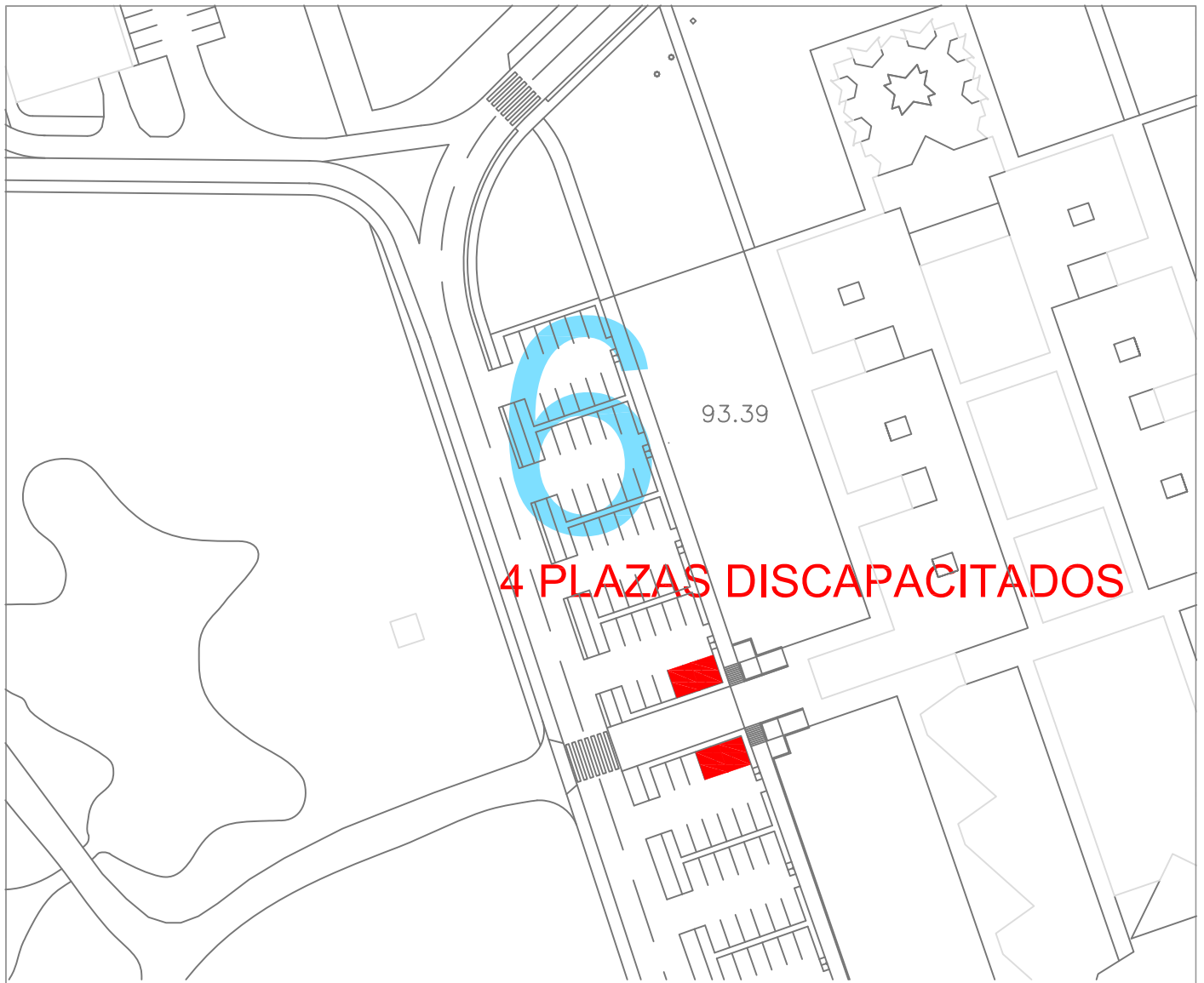
APARCAMIENTO 1. E.1/1000